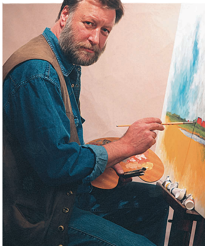
Aus dem Kopf entstehen die charakteristischen Landschaftsmotive des Esenser Malers Hans-Christian Petersen.