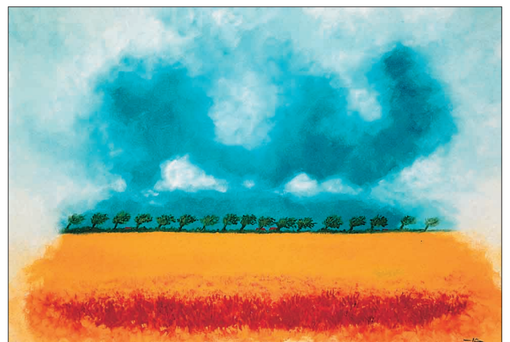
Unendlicher Himmel über flirrendem Feld, geduckte Allee und Höfe am Horizont: die lebendige Erinnerung an einen „Sommer in Friesland“ wird in dem großformatigen Acrylbild wach.

Eine kleine Auszeit gönnt sich Hans-Christian Petersen regelmäßig zum Jahresanfang.